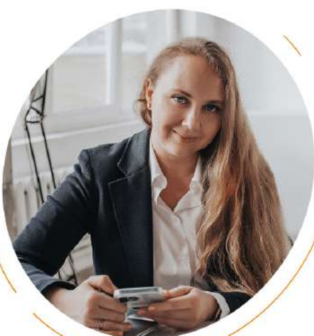
Ксения Падерина Финансовый блогер, журналист

Например, сократите походы в кино на 2500 рублей в месяц, но чуть позже порадуйте себя подпиской на любимые сериалы за 400 рублей».